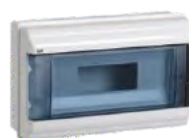
Серия КМПн IP55