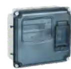
Серия ЩУРН-П IP66 PC